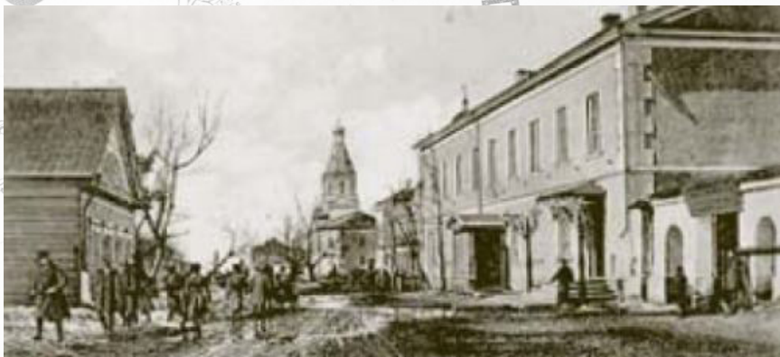
Вид территории Омской крепости. Справа – здание Омского военно-топографического отдела, где в период с октября 1918 по март 1919 гг. располагалось отделение Экспедиции заготовления государственных бумаг. Фото начала XX в.