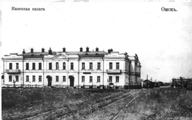
Здание Акмолинского (Омского) областного казначейства и казённой палаты, где в 20-е гг. XX в. располагался Омский губернский финансовый отдел. Фото начала XX в.