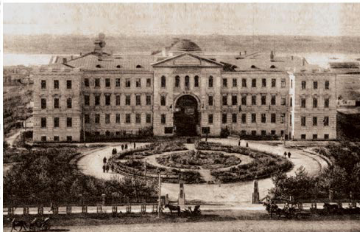
Здание Судебных установлений в Омске, где в 1919–1921 гг. располагался Сибревком и его Финансовое управление. Фото 20-х гг. XX в.