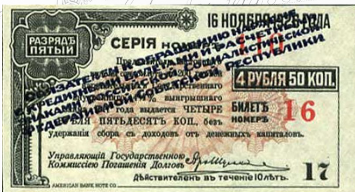
Денежные суррогаты, выпущенные Сибревкомом. 1920 г.