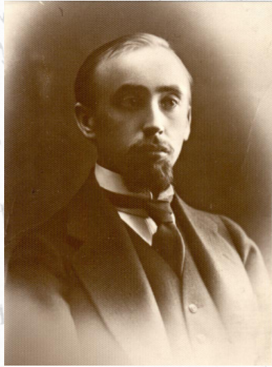
Плич Освальд Юрьевич. Фото 1916 г.