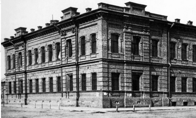
Здание табачной фабрики Серебрякова в Омске, где в январе-ноябре 1919 г. располагалась Экспедиция заготовления государственных бумаг. Фото начала XX в.