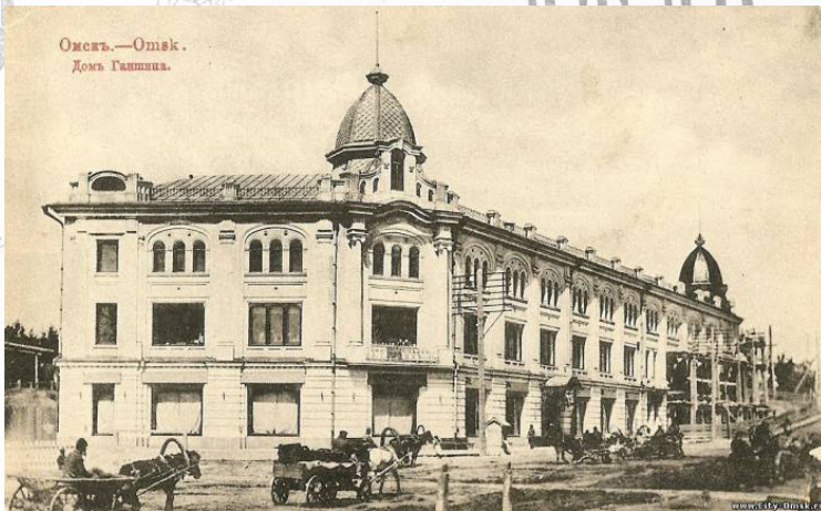
Дом А. Ганшина в Омске, где в период с июня 1918 по ноябрь 1919 г. располагалось Министерство финансов Временного Сибирского, Временного Всероссийского и Российского правительств. Фото начала XX в.