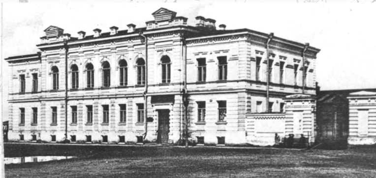
Здание Омского отделения Государственного банка, где в 1918–1919 гг. хранился золотой запас. Фото 1906 г.