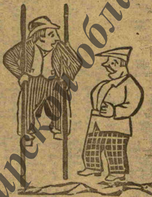
Въ выдачѣ резиновыхъ галошъ.

«Проставь Сержъ! Что это ты вѣду маль акробатическія упражненія продѣлывать?»