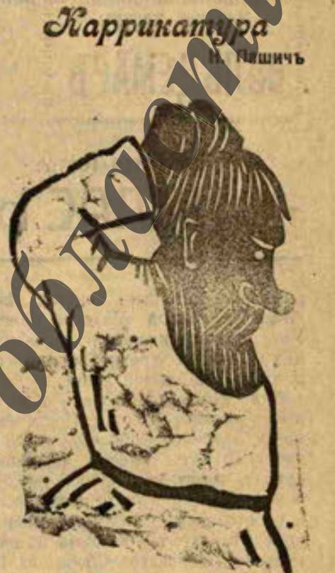
Крестьянинъ: „Хорошо нынѣ дѣла идутъ: двадцатую тыщу кошку и ни одной треклятой „кережки“ нѣтъ...“