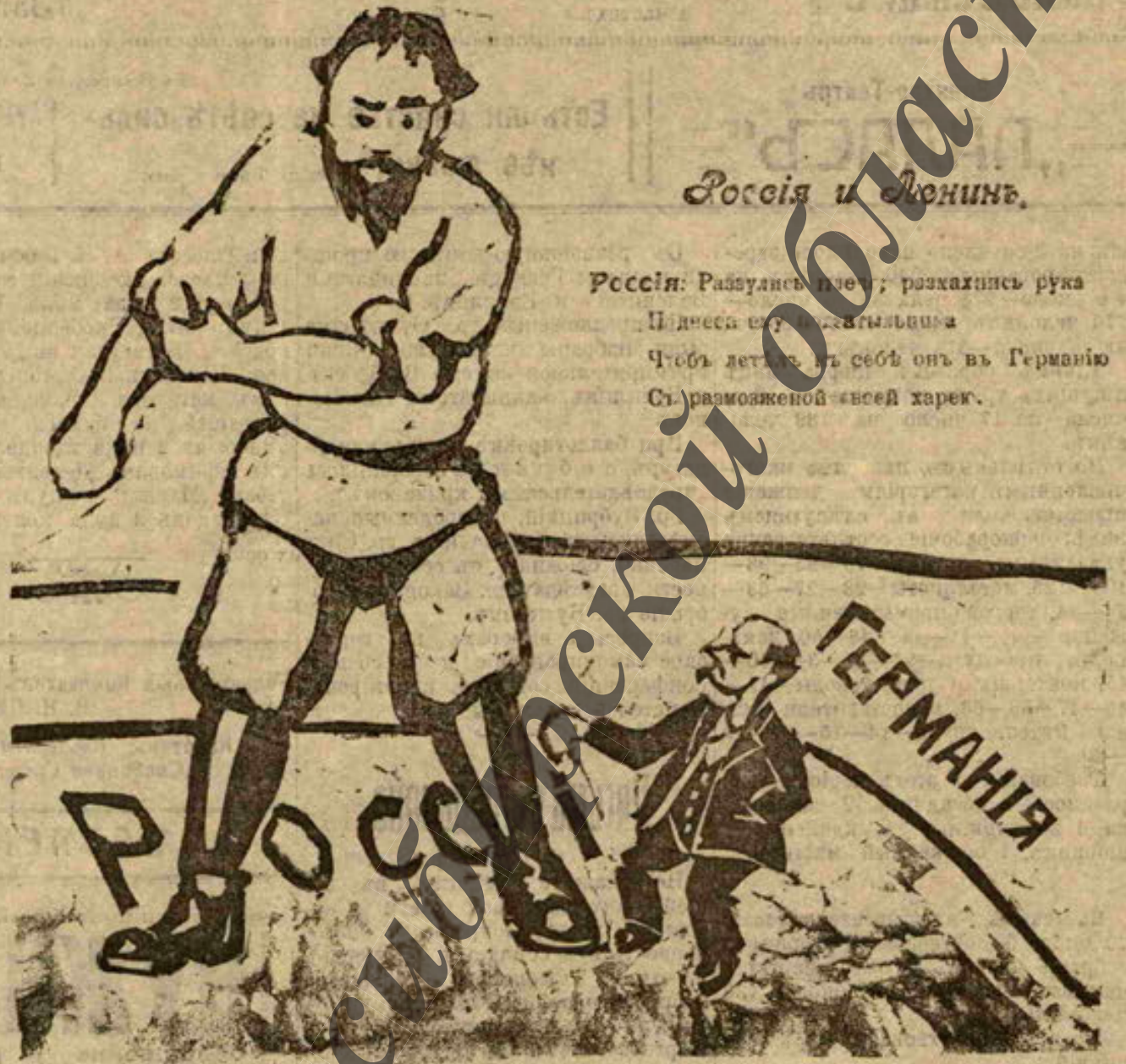
Россия и Ленинъ.

Россия: Разулись плечи; размахнись рука Пидесь ея и вавильница Чтoby деться оть себя оны въ Германию Съ разможенной твоей харек.