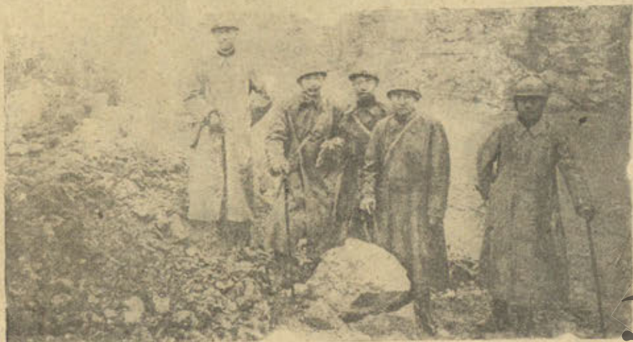
Китайскiе офицеры во время осмотра ими Вердена, прославившагося сверхъгеройскою обороною противъ нѣмецкихъ полчищъ.