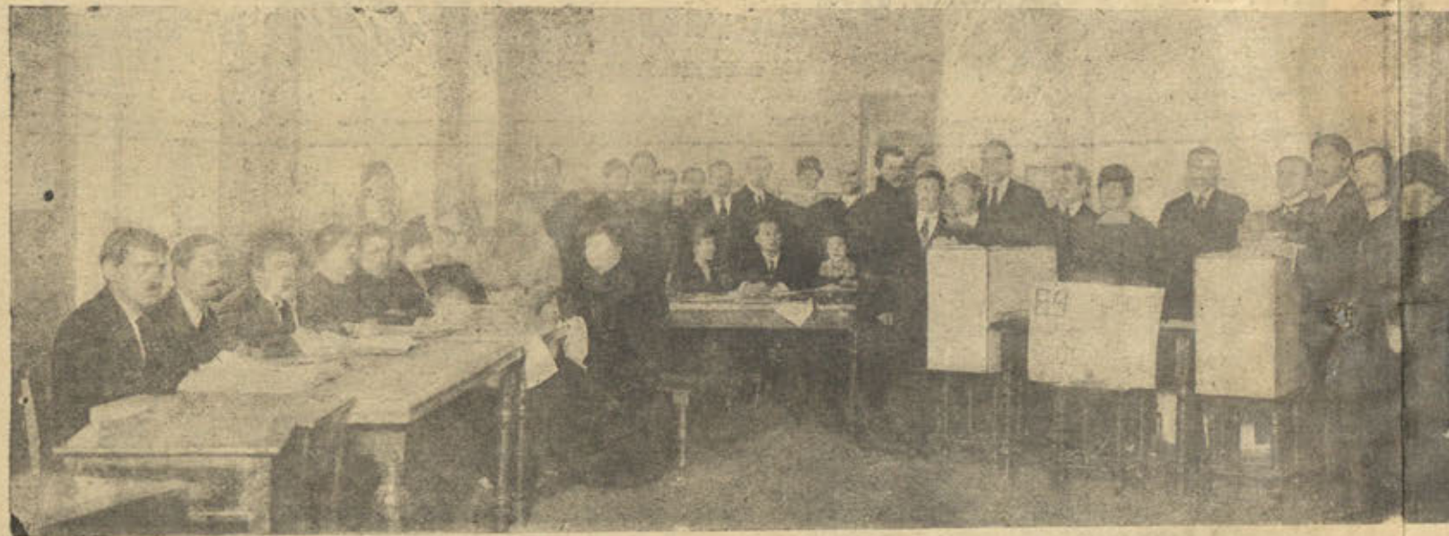
Въ участковой избирательной комиссiи. Члены комиссiи и командированные имъ на подмогу городскiе служащiе производятъ подсчетъ голосовъ, поданныхъ избирателями, и сортируютъ бюллетени по номерамъ списковъ.