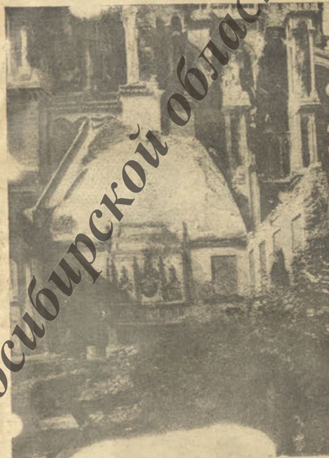
Въ многострадальномъ гор. Реймѣ. Опустошеннiя, полуразрушенныя нѣмецкими снарядами дворянскiя католическаго архiепископа.