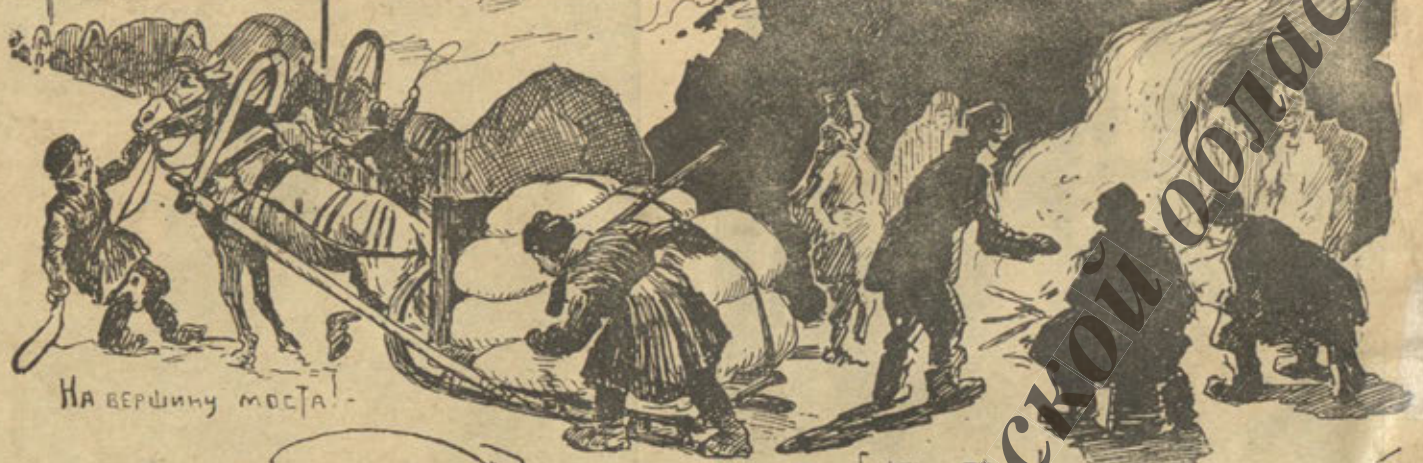
На вершину моста!