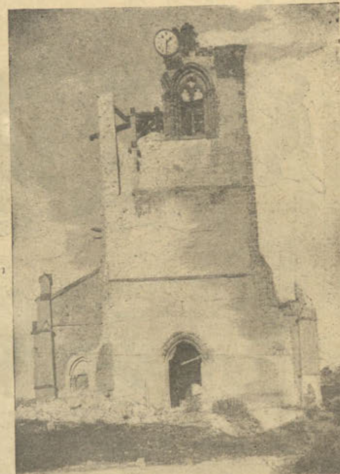
На французскомъ фронтѣ. Полуразрушеннiй нѣмецкою артиллерiей католическаго храма въ районѣ Марны.