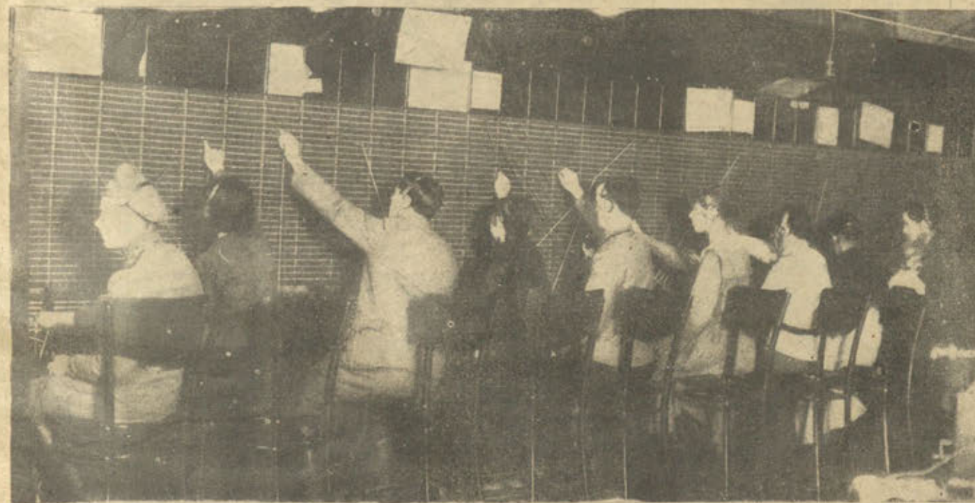
Нто и какъ теперь соединяютъ номера телефонныхъ абонентовъ. Переворотъ 25-26 октября на длинный срокъ лишилъ петроградцевъ удобствъ телефоннаго сообщенiя. Телефонная городская станция въ теченiе нѣсколькихъ дней была даже мѣстомъ боевыхъ столкновенiй. Ныгѣ на станци занимаютъ соединенiемъ номеровъ абонентовъ ба,ышши и солдаты, мало опытные въ этомъ утомительномъ дѣлѣ.