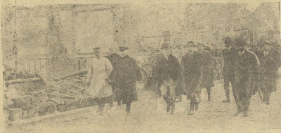
Президентъ Французской республики Пуанкаре и президентъ Португальской республики Мачадо во время посещенiя гор. Шони, на французскомъ боевомъ фронтѣ.