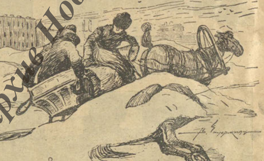
Въ сибирскихъ сугробахъ столицы!