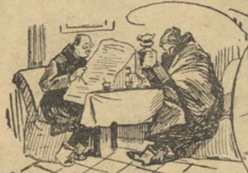
Въ морозный день у домашнего очага!