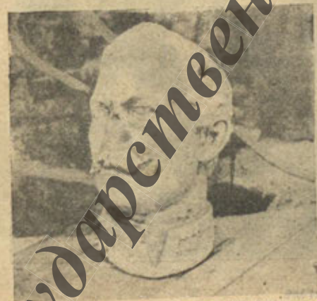
Лицо кайзера Вильгельма II безъ носа, съ пробитымъ черепомъ, съ оторваннымъ усомъ.

Во время одного изъ налетовъ германскихъ авиаторовъ на Лондонъ бомбами были произведены разрушенія въ домъ, гдѣ помѣщался нѣмецкій клубъ. Въ этомъ клубѣ, конечно, имѣлся бюстъ кайзера Вильгельма II. Германскія бомбы не попали на этого бюста и изуродовали его. Во время раскопокъ разрушеннаго дома была обнаружена эта разбитая нѣмцами же голова нѣмецкаго монарха.