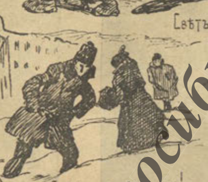
Сибирья (Столичный район)