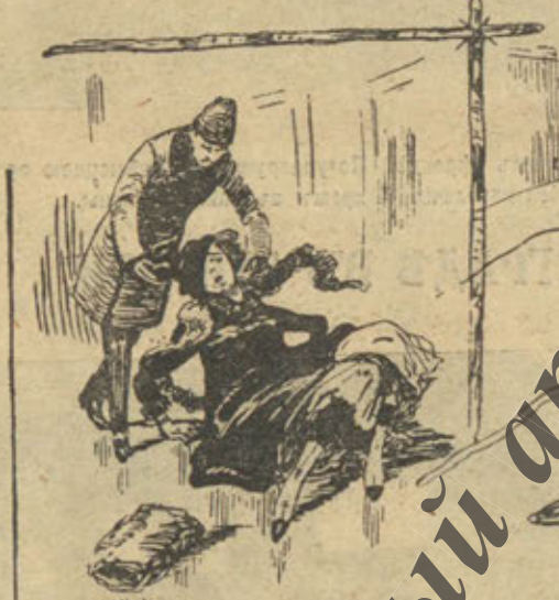
Даровой шапки на Невском проспекте!