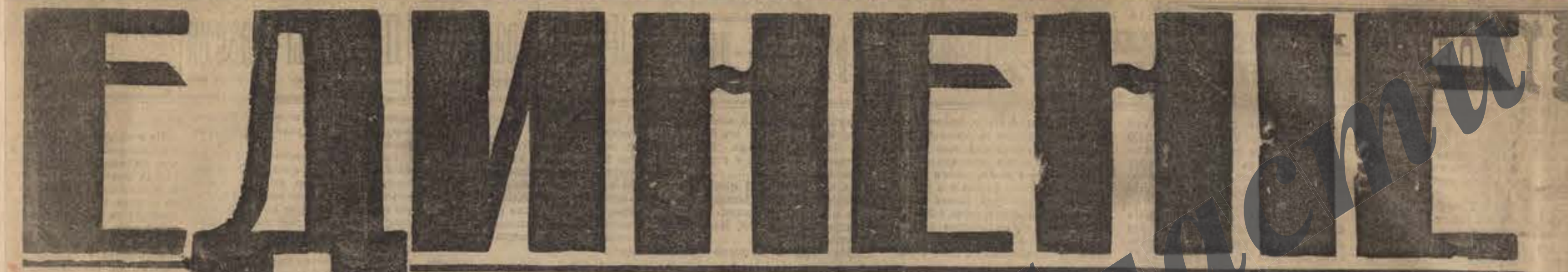
Большая ежедневная общественно-политическая и литературная газета

Органъ Иркутскаго Объединеннаго Съвета Рабочихъ и Солдатскихъ Депутатовъ, Органъ Областнаго Бюро Советовъ Солдатскихъ и Рабочихъ Депутатовъ Восточной Сибири.