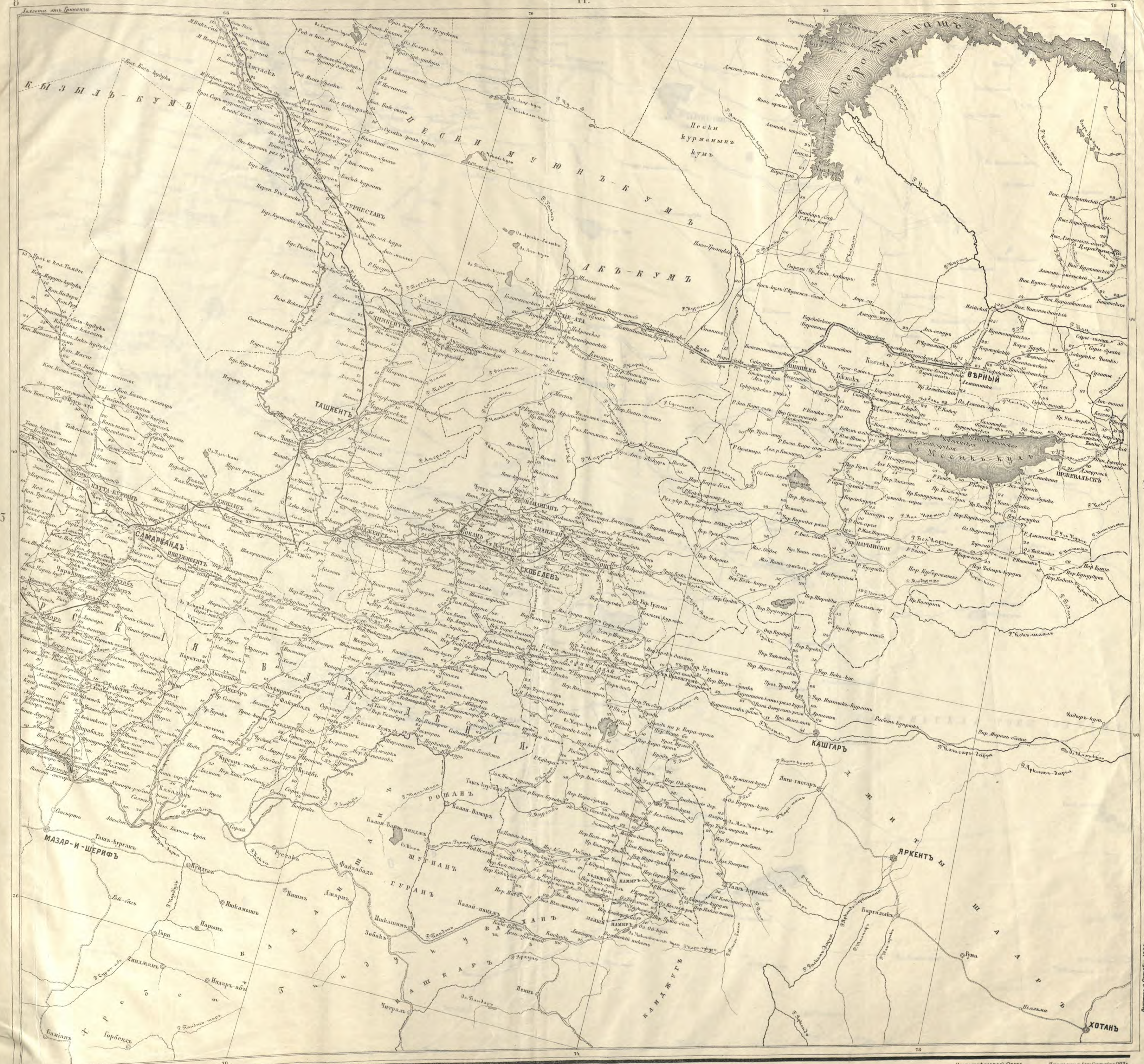
Масштаб 1:200,000 Картографический Отдел Корп. Воен. Топографов, Москва. Издано в Октябрь 1920 г. Число дорог считается в 3-х мерной обрешетке Лексикон Точка при цифрах означает % верста.