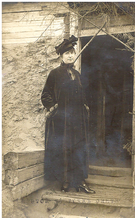
М. А. Гришина. Действующая армия. 11/24 декабря 1917 г.

Весна — лето 1918 г. были звездным часом А. Н. Гришина: он стал командующим Сибирской армии и военным министром Временного Сибирского правительства, получив генеральский чин и официальную приставку к фамилии — Алмазов (псевдоним от белого подполья). Стремительный карьерный взлет супруга обусловил резкую перемену социального статуса молодой генеральши.