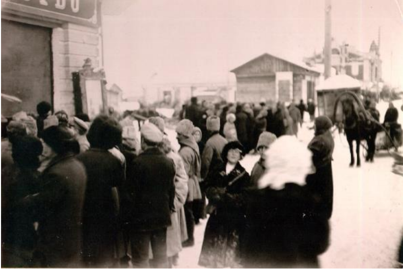
Рис. 3. Ново-Николаевск. Накануне выборов в Учредительное собрание. Ноябрь 1917.

Далее выборы во Всероссийское учредительное собрание. Эсеры по стране получают 40 % голосов (против 16 % большевиков), а в Ново-Николаевске 66,4 % (против 11,7 % за большевиков) [9]. Подводя итоги выборов, томская газета «Путь народа» от 12 декабря заявляет, что в целом по Ново-Николаевскому уезду эсеры взяли целых 92,5 % голосов.