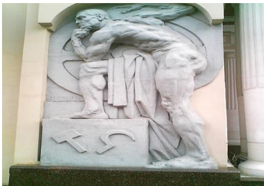
Рис. 5. Скульптура «Рабочий» (скульптор — М. Г. Манизер)