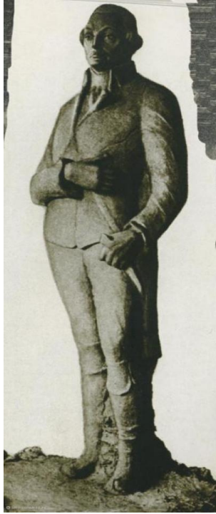
Рис. 4. Памятник Робеспьеру в Александровском саду (скульптор — Б. Ю. Сандомирская)

В 1918-1919 годах по всей стране было открыто множество разных скульптур, барельефов, мемориальных досок, план реализовывался в кратчайшие сроки. Однако, в стране на тот момент шла гражданская война. Прочного материала не хватало. Экономическое положение оставляло желать лучшего. Памятники создавались из гипса, дерева и бетона, поэтому очень быстро разваливались. Однако, в 1920-е годы, когда война уже приближалась к своему завершению, а экономическое положение страны изменилось в лучшую сторону, памятники стали строить из более прочного и долговечного материала. В 1921 году на стене Петровского пассажа появляется знаменитая скульптура «Рабочий» работы Манизера, символизирующая новый правящий класс страны Советов. В 1922 году в Москве появляются памятники Герцену и Огарёву, которые по сей день стоят у входа в корпус МГУ на Моховой улице. В 1923 году у Никитских ворот был установлен памятник Тимирязеву, который тоже сохранился по сей день.