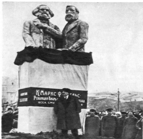
Рис. 1. Памятник Марксу и Энгельсу, площадь Революции (скульптор — С. А. Мезенцев)