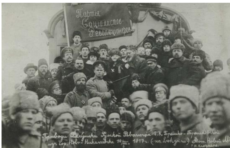
Рис. 2. Проводы бабушки русской революции Е. К. Брешко-Брешковской (в центре). 10.03.1917. ГАНО. Ф. П-11796, оп.5, д.25а

ческих организаций и огромная толпа народа. Поезд подошел при звуках «Марсельезы», которую исполнял военный оркестр. Бабушка вышла на площадку вагона II класса. Конечно, громовое «ура» многотысячной толпы, приветствия столпов города. «Бабушка отвечала на речи указанием, что она никогда не отчаивалась в победе народа и теперь счастлива этой победой, надо помнить, что победа не закончена, что борьба почти вся еще впереди. Надо работать для народного дела, не покладая рук. В этом благо и счастье» [3]. Бабушка выступила в Думе, перед горожанами, переночевала, а на следующий день не менее торжественно поехала дальше на запад.