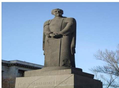
Рис. 7. Памятник Тимирязеву, Никитские ворота (скульптор — С. Д. Меркуров)