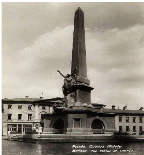
Рис. 2. Монумент советской конституции, Советская площадь (архитектор — Д. П. Осипов, скульптор — Н. А. Андреев)