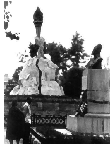
Так выглядел Сквер Жертв революции

После войны здесь похоронили еще одного революционера, но уже французского – последнего ветерана Парижской коммуны Адриена Лежена, который с началом Великой Отечественной войны был эвакуирован в Новосибирск и умер здесь 9 января 1942 г. в возрасте 94 лет. В сквер его прах перенесли с Заельцовского кладбища в 1946 г., а в 1971 г. перезахоронили в Париже, на Пер-Лашез. На месте бывшего захоронения сегодня лежит надгробная плита-памятник (кенотаф).