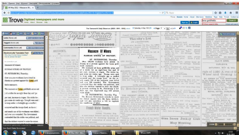
Рис. 2. Снимок экрана с изображением сайта Trove национальной библиотеки Австралии. Отображена газетная статья по запросу «Lena Goldfields» с ограничением поиска в пределах 1912 г.

В отличие от библиотек, архивы, как правило, ограничиваются рядом наиболее популярных источников и фондов, выставленных в открытом доступе на сайте (например, списки ветеранов Первой мировой войны, реестры судов, эмигранты и др.). Эти документы, как правило, выставлены не в виде сканированной копии, а введены в автоматизированную поисковую систему, которая позволяет находить и отображать требуемые данные. В то же время, некоторые крупнейшие архивы – например, Национальный архив Великобритании [The National Archives] – размещают на своих сайтах описи дел в автоматизированных поисковых программах, что существенно облегчает поиск материалов. Система позволяет заказать электронную копию требуемого дела через интернет за определенную плату.