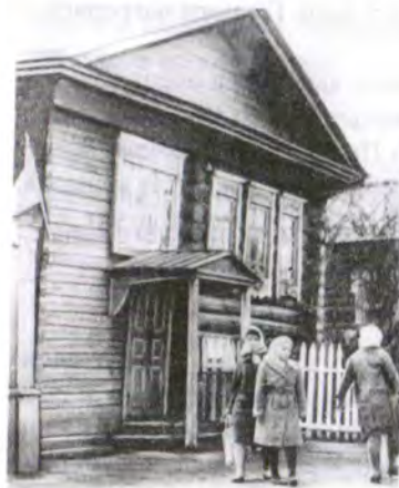
с. Колывань Новосибирской области. Дом, в котором в 1890 году делал остановку А. П. Чехов во время поездки на о. Сахалин (дом сохранился)

(Подготовлено М. И. Корсаковой по материалам т.т. XIV–XV полного собрания сочинений и писем А. П. Чехова в тридцати томах, а также ГАНУ ФР-2016 Оп. 1 Д. 35. Фотографии и документы представлены отделом архивной службы территориальной администрации Колыванского района).