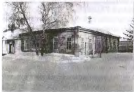
Кольванское отделение связи (почта) 2001 г.

...И долго нужно пожить, обжиться, привыкнуть к населению, чтобы уничтожить это предубеждение. Большинство же приезжих путешественников находится именно под этим впечатлением. Таким образом, мы можем следить за психологией наших туристов, и она нам вполне понятна, хотя и извращает действительность. Достаточно привести в пример путевые впечатления А. Чехова, который поехал в Сибирь и на Сахалин в самое скверное время года, в распутицу — реки были в раз-