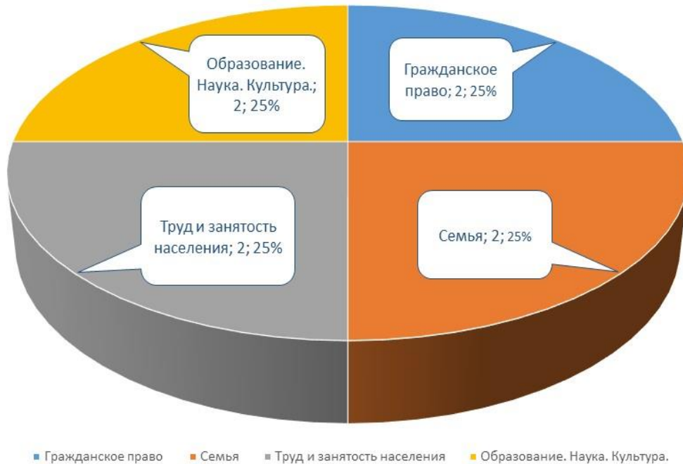
Тематика письменных обращений (III кв. 2023 г.)