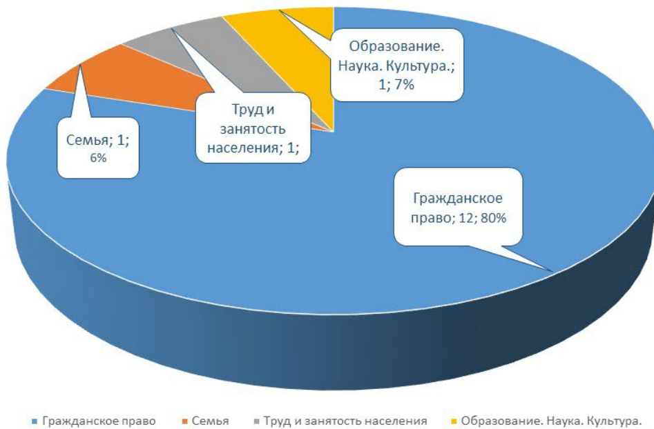
Тематика письменных обращений (II кв. 2023 г.)