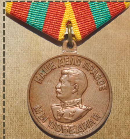
Медаль «За доблестный труд в Великой Отечественной войне 1941—1945 гг.»