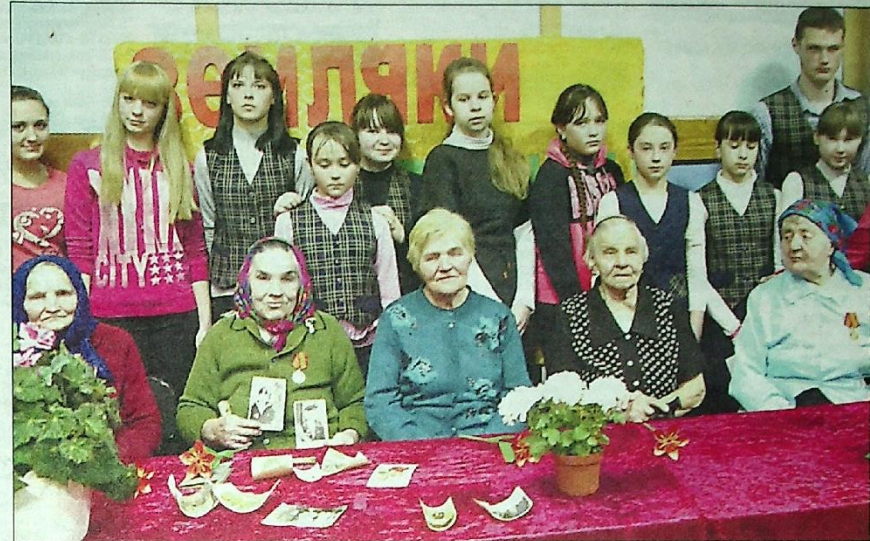
Встреча поколений в Еланской библиотеке