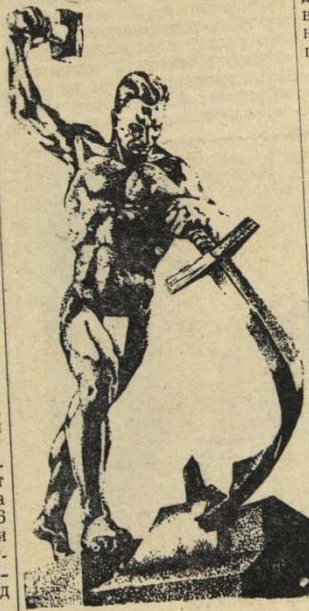
Перекуем мечи на орала!

По окончании торжественного заседания был дан концерт художественной самодеятельности.