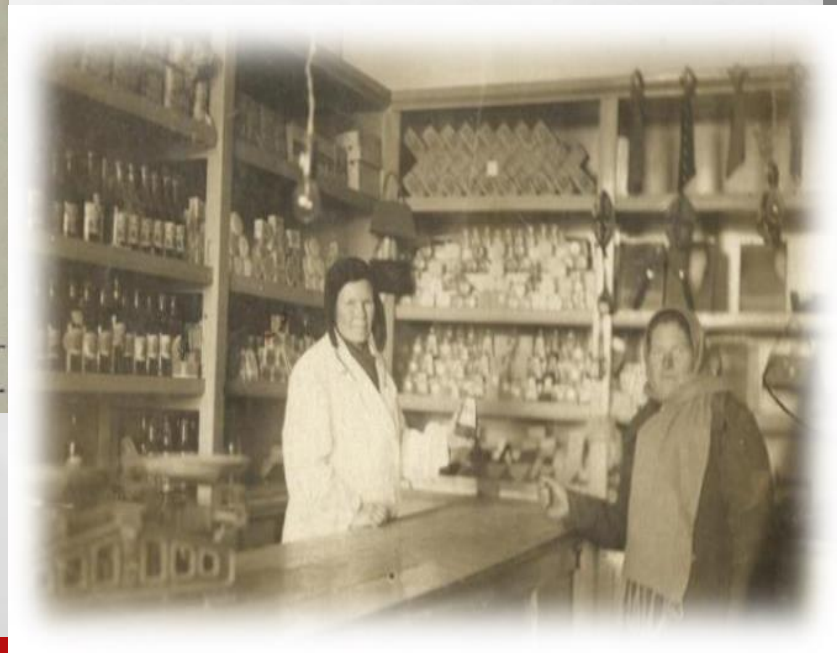
Колыванское сельпо 1941 год