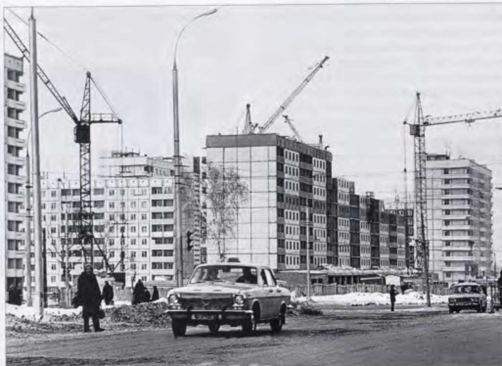
Строительство Челюскинского жилмассива