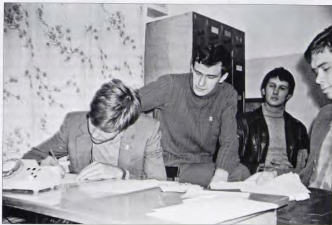
Оперативный комсомольский отряд дружинников (ОКОД) Новосибирского электротехнического института

Литература и документальные источники: Сов. Сибирь. — 1922. 11 сентября; Сов. Сибирь. — 1929. — 24 февраля. — № 45. — С. 6; Сов. Сибирь. — 1929. — 5 марта. — № 52. — С. 4. ГАНО. Ф. П — 4. Оп. 33. Д. 1847. ЛЛ. 54, 55, 56.