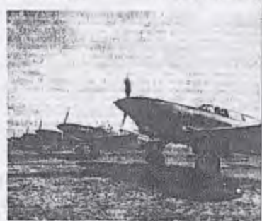
«Комсомольская правда» за 5 июня 1942 года

Документальные источники: ГАНУ. Ф.П-4. Оп. 33. Д. 446. Л. 4; Ф.П-5а. Оп. 1. Д. 433. ЛЛ. 38, 40; Ф.П-190. Оп. 1. Д. 77. ЛЛ. 220, 225, 242; Д. 86. Л. 2; Д. 89. ЛЛ. 117, 119 об., 153—155; Д. 91. Л. 2; Оп. 2. Д. 644. ЛЛ. 26, 30, 63, 75—81; Д. 712. ЛЛ. 38—49.