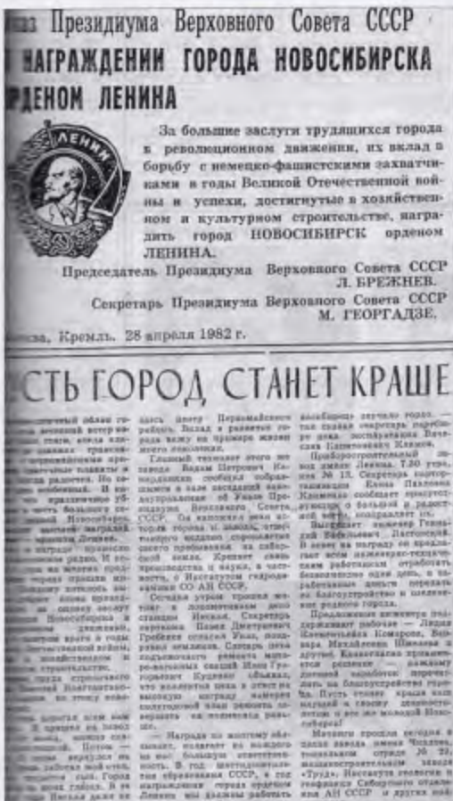
«Вечерний Новосибирск», 29 апреля 1982 г. № 99(7384), С. 1.

28 апреля 1982 г. был опубликован Указ Президиума Верховного Совета РСФСР о награждении г. Новосибирска орденом Ленина за большие заслуги трудящихся города в революционном движении, их вклад в борьбу с немецко-фашистскими захватчиками в годы Великой Отечественной войны и успехи, достигнутые в хозяйственном и культурном строительстве. Указ был подписан Председателем Президиума Верховного Совета СССР Л. Брежневым и секретарем Президиума Верховного Совета СССР М. Георгадзе.