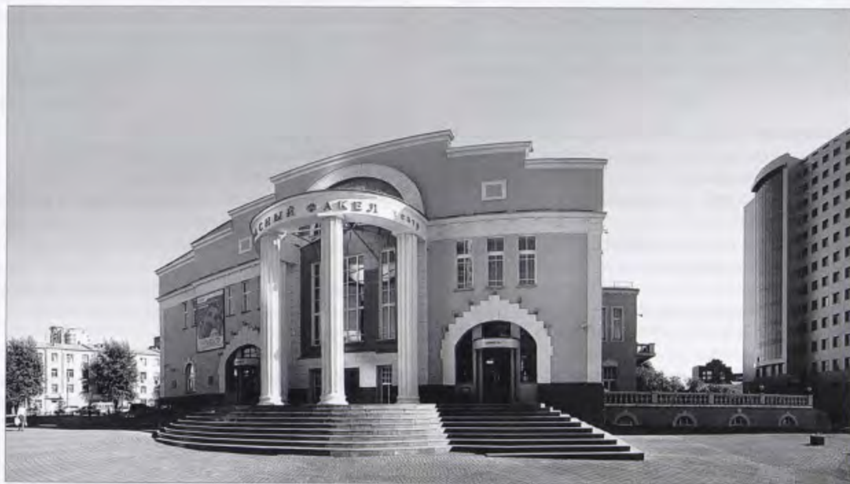
Театр «Красный факел»