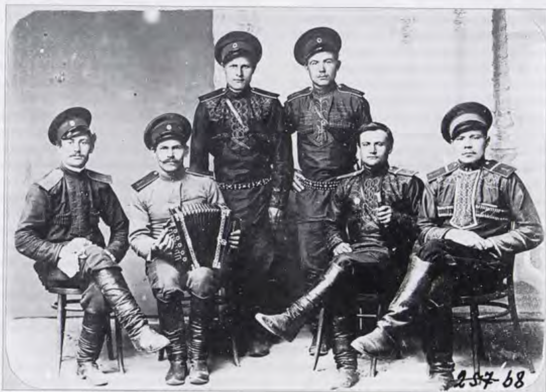
Из фотоальбома Сибирского казачьего войска «Типы казаков. Сибирские казаки на службе и дома». Снимок сделан Н.Г. Катанаевым в 1909 г. во время поездки по казачьим поселкам Степного края.

Источники: текущие архивы организаций, материалы казачьего информационно-аналитического центра kazak-center.ru