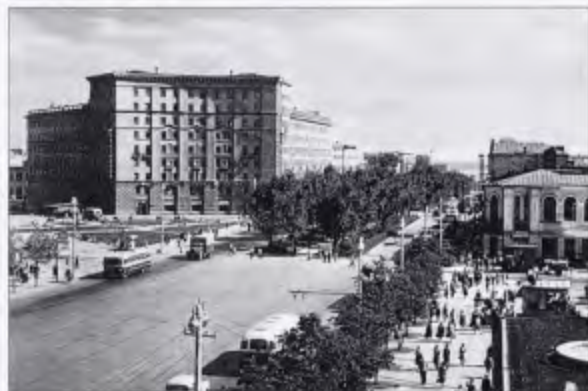
Новосибирск. 100 лет. События. Люди. — Новосибирск, 1993. — С. 290.

В июле 1962 г. в Новосибирске зарегистрирован миллионный житель.