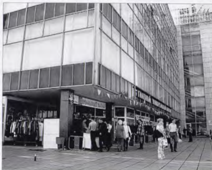
Главный универсальный магазин «Россия»

По документам фонда архивного отдела администрации Барабинского района.