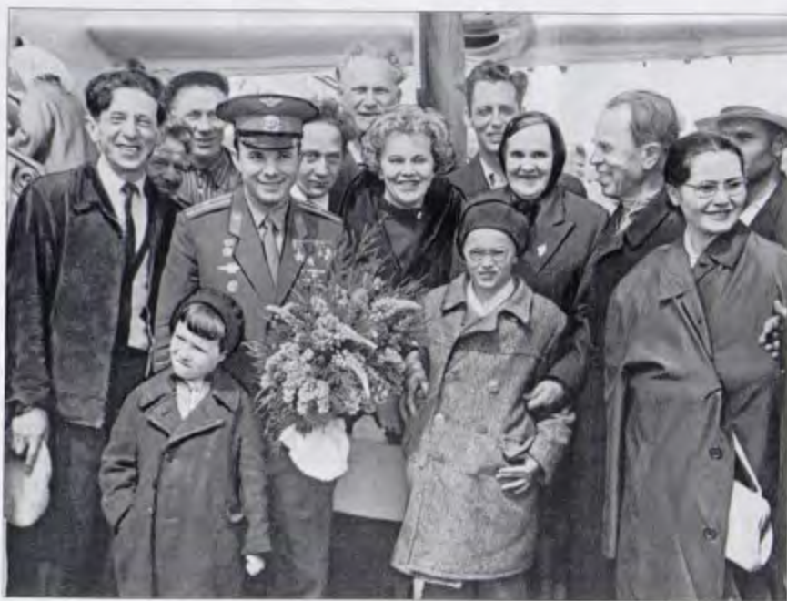
Юрий Гагарин с работниками аэропорта Толмачево. 1962 год

Литература: Ведомости. — 2011. — 15 апреля. — №17. — С. 10.