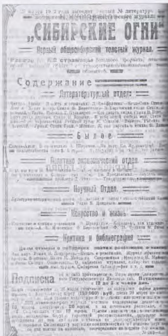
Советская Сибирь. Новониколаевск, 1922 г. № 61(711), С.4.