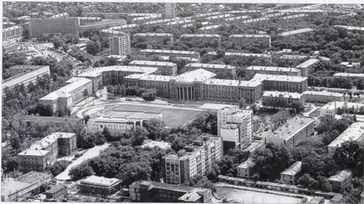
Комплекс Сибирского государственного университета путей сообщения (СГУПС)

Административно-территориальное устройство Новосибирской области. 1937 — 2006 гг. — Новосибирск, 2006.