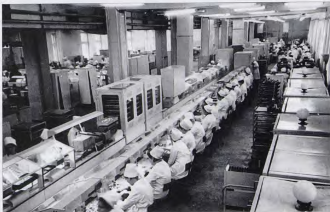
Цех № 1

Литература: Календарь знаменательных и памятных дат по Новосибирской области. — Новосибирск, 2002. — С. 11; www.oksid.com