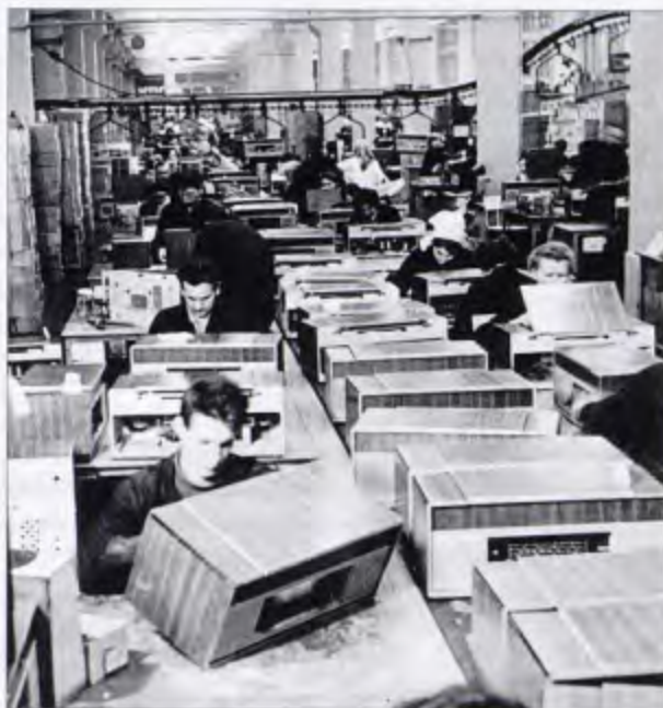
Бердский радиозавод. Цех №1. Сборка «Рекордов»

27 июня 1965 г. газета «Советская Сибирь» опубликовала информацию о том, что на межреспубликанской оптовой ярмарке электробытовых машин и приборов большой успех имела продукция Бердского радиозавода. Особый интерес вызвала новая радиола «Рекорд-65».