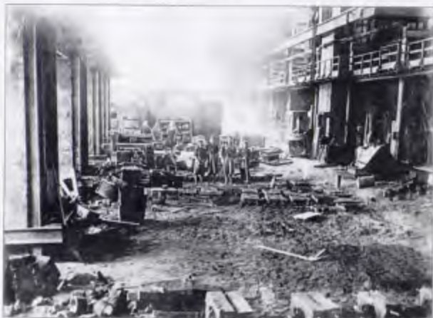
Участок чугунолитейного цеха. 1940-е годы

21 февраля 1942 г. Совет Народных Комиссаров СССР принял постановление о строительстве в Новосибирске завода тяжелых и расточных станков. 21 августа 1942 г. завод переименован в «Тяжстанкогидропресс».