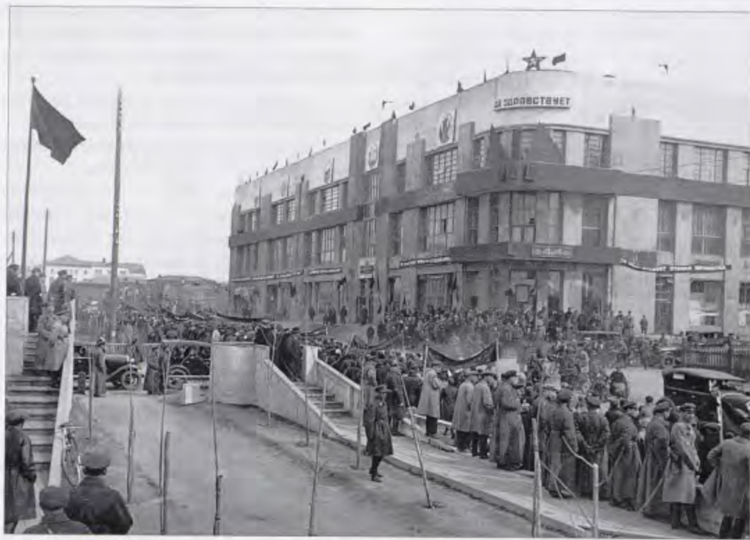
Демонстрация на Красном проспекте, 1933 г.

Литература и документальные источники: ГАНО. Ф.Р-627. Оп. 1. Д. 696; Д. 697; Д. 698; Д. 699; Д. 760; Сов. Сибирь. — 1932. — 9 апреля. — С. 1; Сов. Сибирь. — 1932. — 16 апреля. — С. 3.