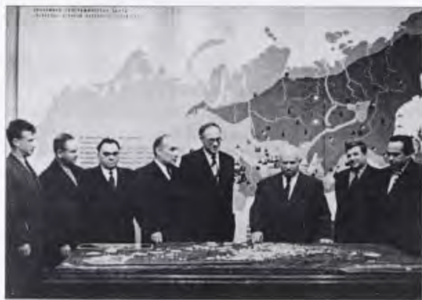
Решения партии и правительства по хозяйственным вопросам. 1917—1967 гг. Т. 4. — С. 347.

18 мая 1957 г. Совет Министров СССР поддержал инициативу академиков М. А. Лаврентьева и С. А. Христиановича о создании в Сибири научного центра и принял постановление «Об организации Сибирского отделения АН СССР». В состав Сибирского отделения были включены Западно-Сибирский, Восточно-Сибирский, Якутский и Дальневосточный филиалы АН СССР, академические институты Красноярска и Сахалина. Документ предусматривал также открытие 10 новых научно-исследовательских институтов.