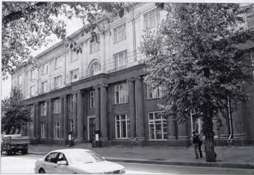
Новосибирская государственная консерватория им. М. И. Глинки

Литература: Новосибирск: Энцикл. — Новосибирск. 2003. — С. 117; Веч. Новосибирск. — 2002. — 30 марта. — С. 4; Честное слово. — 1997. — № 10. — С. 23.