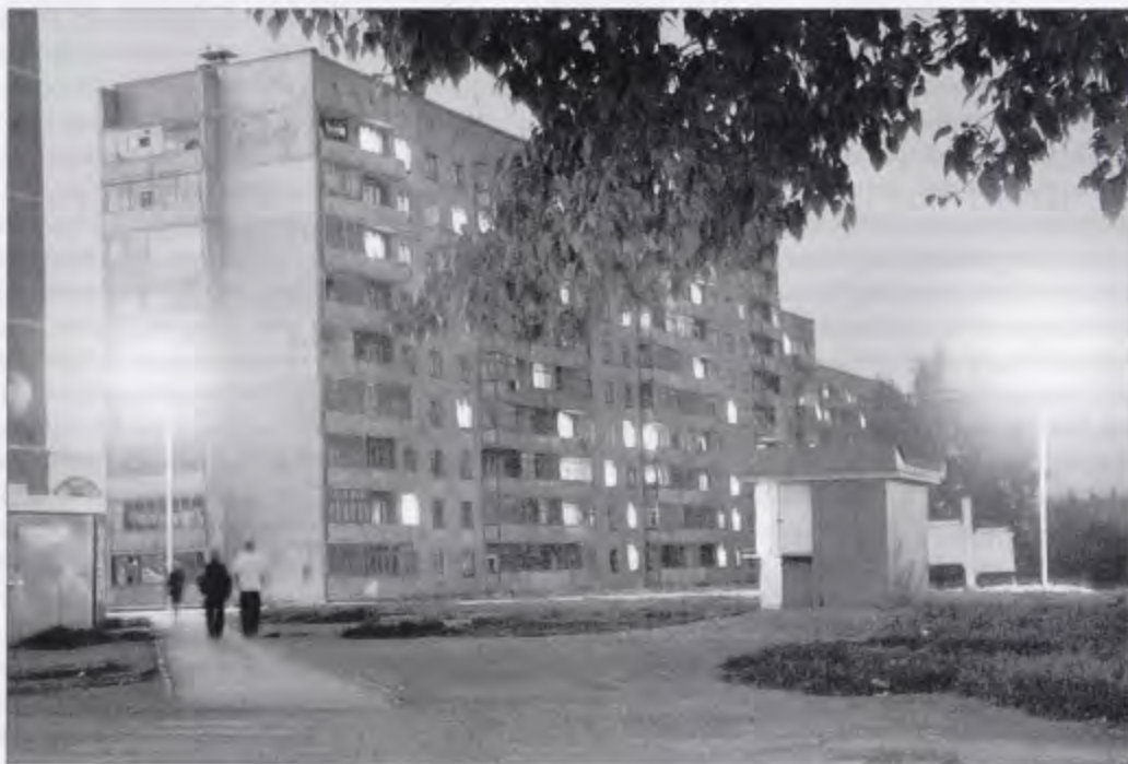
Жилой дом работников Искитимского шиферного завода

Документальные источники: Максимов Г. Искитим XX век: Хроникально-документальный рассказ. — Искитим: ГУП ПО «Междуречье», 2000; Материалы фондов отдела архивной службы администрации г. Искитим; www.admiskitim.ru