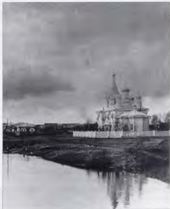
Церковь с. Покровское