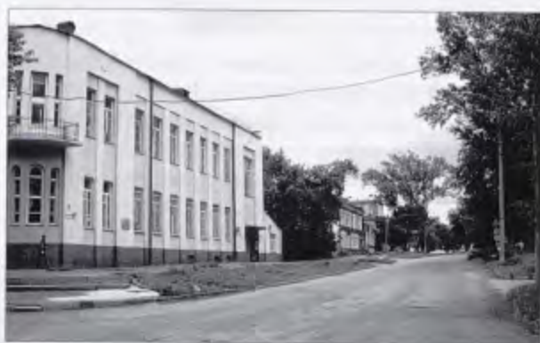
Родильный дом № 1

28 августа 1882 г. родился Гумилевский Александр Павлович (1882—1959), заслуженный врач РСФСР. В 1920—1946 гг. — главный врач Центрального городского родильного приюта (род-