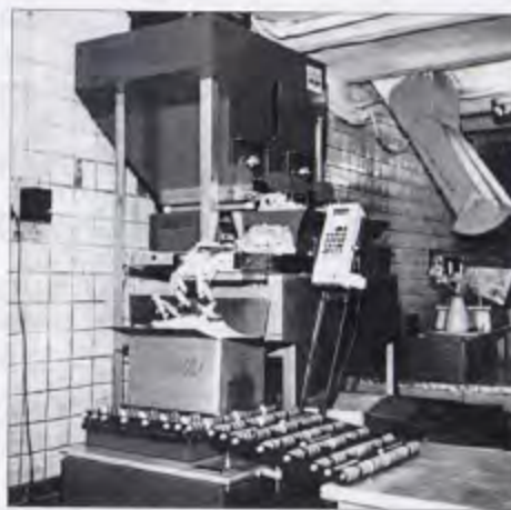
Участок завеса готовой продукции

Ассортимент Новосибирской шоколадной фабрики военных лет был следующим: плиточный и фигурный шоколад, шоколадный порошок, несколько сортов полуфабриката для кондитерской фабрики «Красная Сибирь» и Горمولзавода, конфеты «Сказка», «Сливочная помадка», «Изюмная», «Маскарад», «Пальмира», а чуть позже — «Гном» и «Мокко». Предприя-