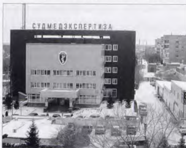
Новосибирск: энциклопедия. — Новосибирск, 2003. — С. 623; sibsme.ru.

В 1952 г. организовано Новосибирское областное бюро судебно-медицинской экспертизы.