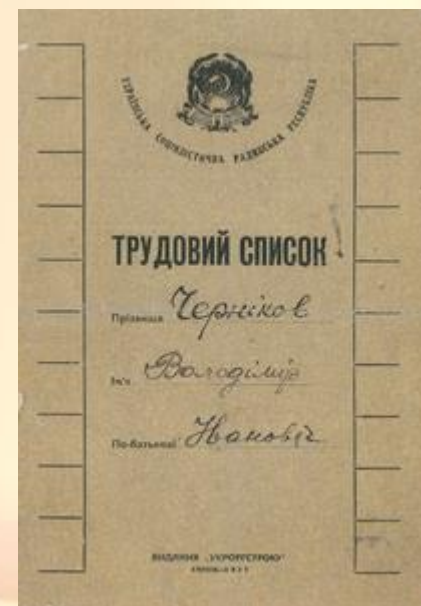
Трудовой список для Украинской ССР

Трудовые списки заполнялись на всех служащих учреждений, зачисленных на постоянную работу. При переходе служащего в другое учреждение трудовой список выдавался ему на руки для предъявления по новому месту работы.