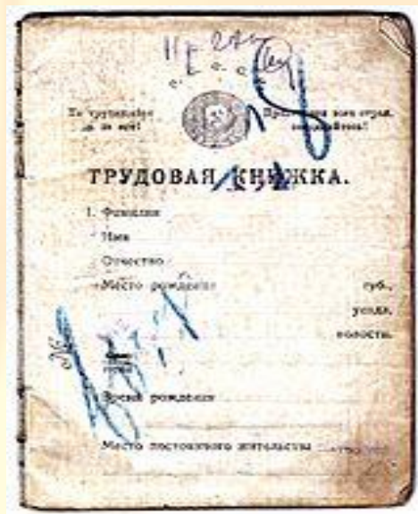
Трудовая книжка. 1921 года по декрету от 1919 года