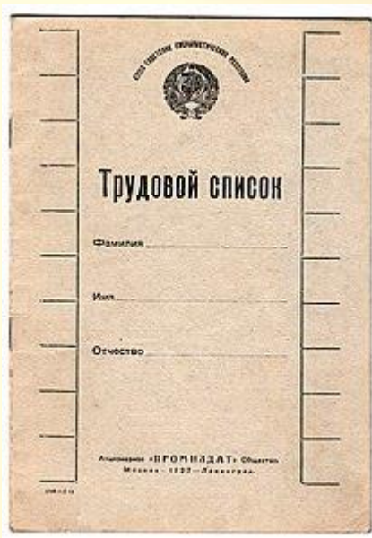
Трудовой список для РСФСР

В трудовых списках содержались сведения социально-политического характера: о социальном положении и происхождении, о партийности, об участии в профсоюзах или выборных органах, о воинском учете.